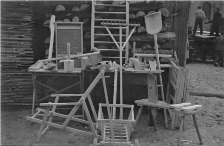
Produkcja Resortu Stolarskiego