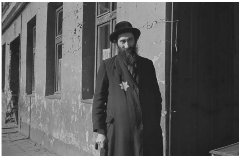
Portret ortodoksyjnego Żyda

kich agend administracji getta – począwszy od zakładów produkcyjnych i biur, na ochronkach dla dzieci i szpitalach skończywszy – są źródłem pozwalającym zidentyfikować najważniejsze osobistości getta, jego topografię, wygląd ulic, fabryk etc. Należy zwrócić uwagę również na to, że autorstwo ogromnej części zdjęć składających się na tych kilka kolekcji trzeba przypisać ofiarom. O ile zdjęcia wykonywane w ramach pracy w Wydziale Statystycznym mają głównie wartość dokumentacyjną, o tyle fotografie nielegalne czy prywatne przedstawiają tę część życia getta, do której naziści nie mieli dostępu (intymne sceny życia rodzinnego) lub której nie chcieli pokazać (wysiedlenia i przemoc).