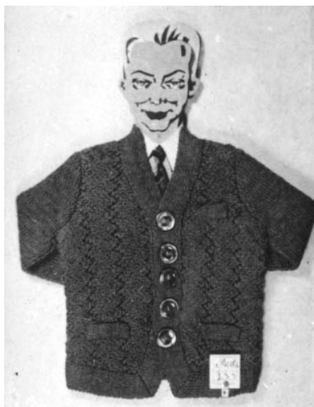
Produkty wykonane w getcie

skiego: „Praca i spokój” 28 . Ponadto z kolekcji można wydzielić dwa rodzaje zdjęć ze względu na ich przeznaczenie. Jedne były tworzone z myślą o dokumentowaniu oficjalnego życia getta, podczas gdy inne wydają się pełnić funkcję reklamo-