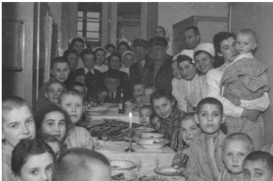
Rumkowski podczas kolacji sederowej w sierocińcu na Marysinie