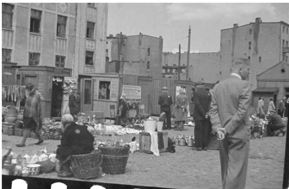
Hans Biebow na spacerze po getcie