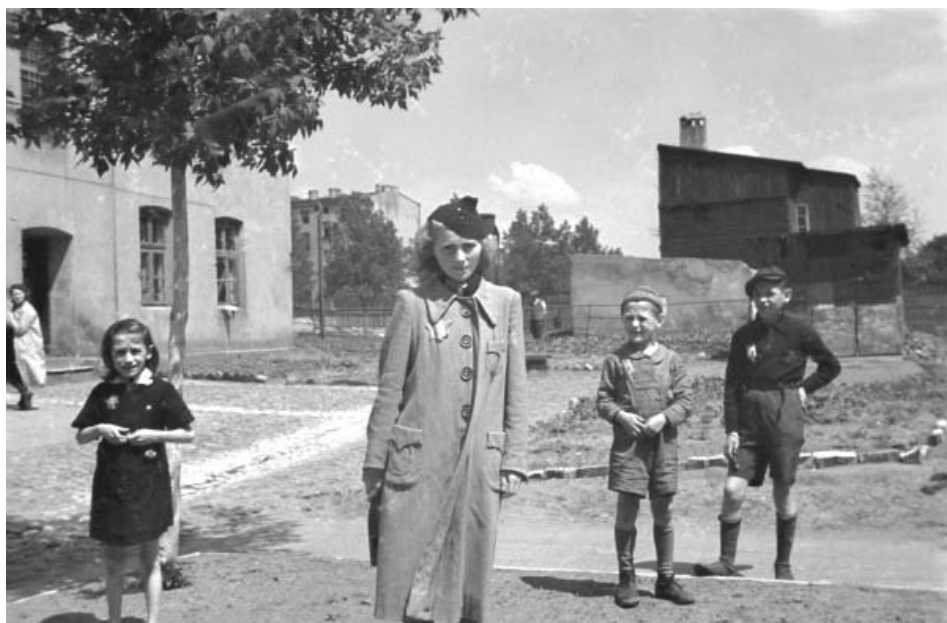
Kobieta z grupą dzieci w getcie