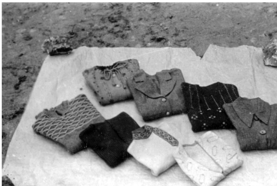
Produkcja Resortu Tekstylnego