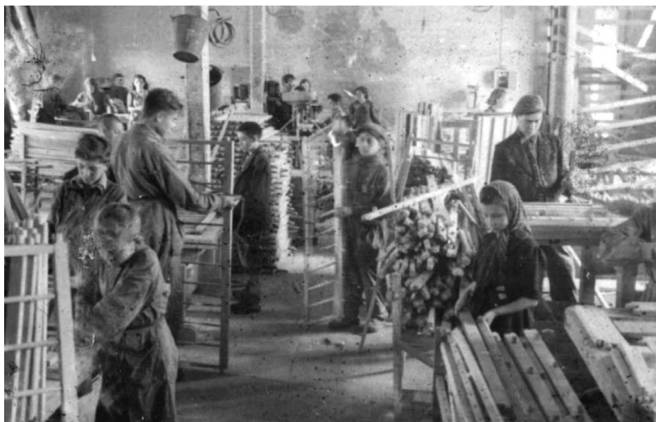
Praca w Resorcie Stolarskim